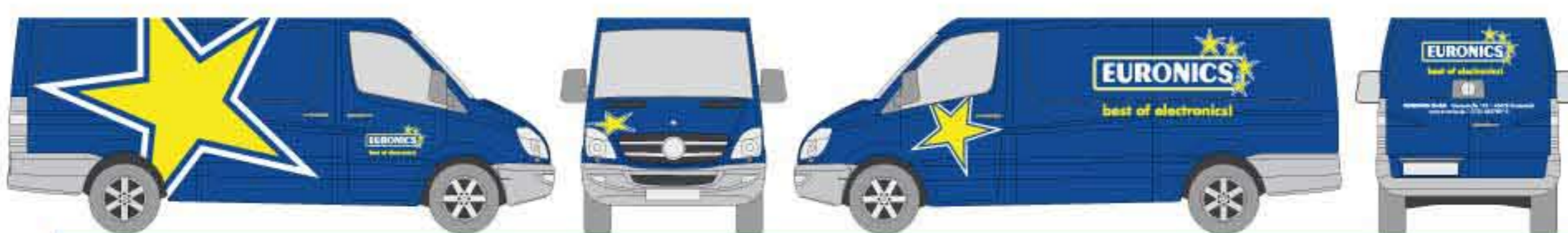
Folienpaket für Fahrzeugbeschriftung Typ IV übertragungsfertig, firmenbezogene Beschriftung gemäß Vorgaben der EURONICS