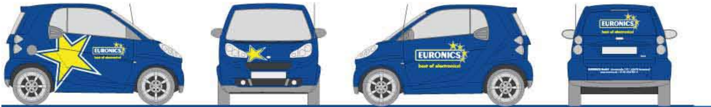
Folienpaket für Fahrzeugbeschriftung Typ I übertragungsfertig, firmenbezogene Beschriftung gemäß Vorgaben der EURONICS