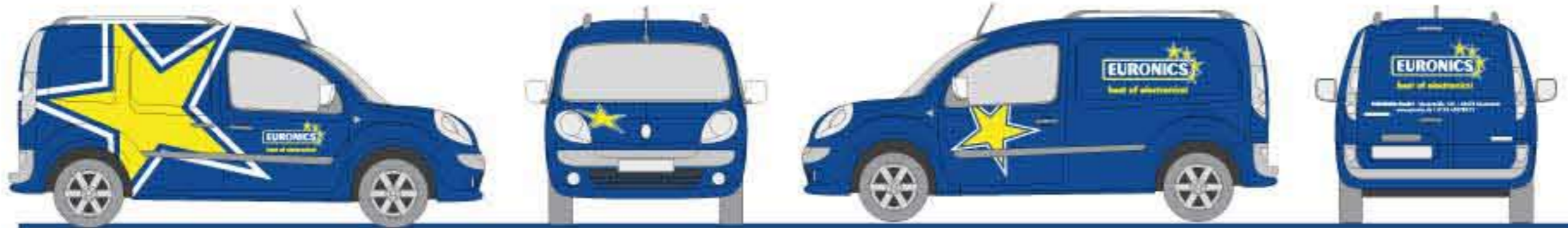
Folienpaket für Fahrzeugbeschriftung Typ II übertragungsfertig, firmenbezogene Beschriftung gemäß Vorgaben der EURONICS